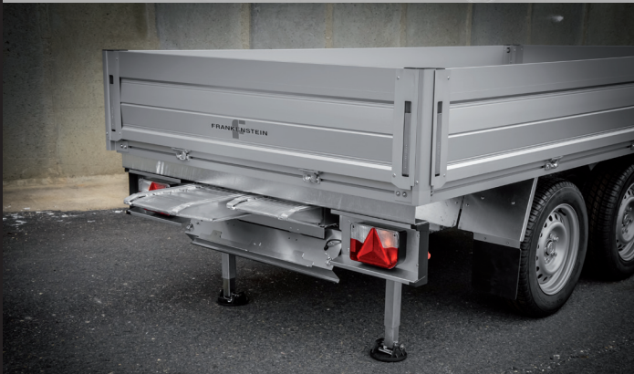
Auffahrschienen inkl. Halterung (optional)