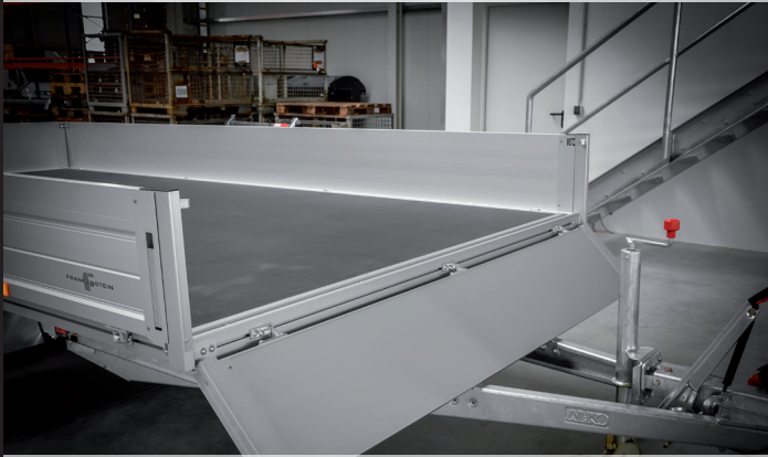
Vorderwand klappbar (optional)