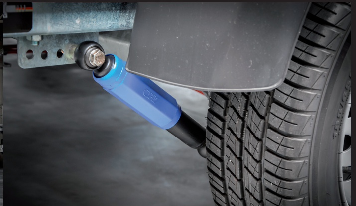
Stoßdämpfer, 100km/h Zulassung (optional)